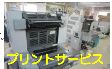
プリントサービス

一人ひとりが能力を発揮できる職場をめざされています。活動内容はプリントサービス（印刷）、ハンドワークス（手作業）、ドリームワークス（創作）が行われており、自動販売機用手袋の梱包作業や、大久野島うさぎシール等の製品を拝見しました。どの