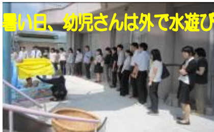
暑い日、幼児さんは外で水遊び

施設入所者の高齢化が進む中、近年力を入れているのは週3回を目標に行っているリハビリや、メンタル面のケア、食事の摂取と健康に直結する口腔ケア（ともに医師が来所）ということでした。また、「お子さまも、お年寄りも障害のある方もない方もみんな一緒にいるのがノーマル（普通のこと）」をモットーに多世代交流・支援センターとしての役割も担っているということです。