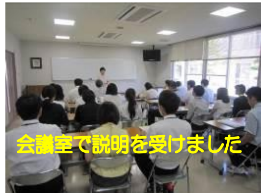
会議室で説明を受けました

東広島市八本松町にある「ときわ台ホーム」は、4つの基本理念「より潤い豊かな心と生活を」「よい笑顔 良い言葉 よい心」「自立 共生 そして創造」「地域に愛され 信頼され とともに歩む施設」を実践運営されている、生活介護の定員130名（うち120名が施設入所）の大規模な障害者支援施設です。