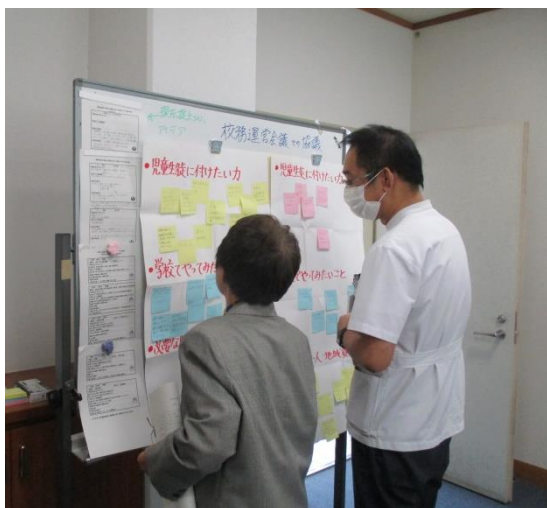
【校務運営会議の 協議シートをご覧になる様子】

今回の貴重ご意見を気付きとして、「地域とともにある学校づくり」を目指して、今後も校内でも様々な取組を進めていきたいと計画しています。次回は、2月に行われます。