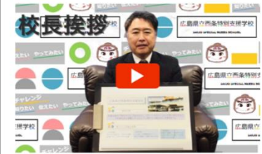
【校長挨拶】広島県立西条特別支援学校