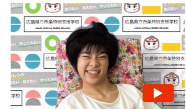
【生徒挨拶】広島県立西条特別支援学校