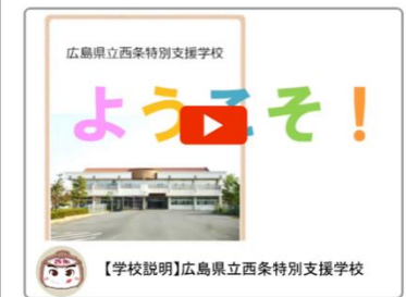
【学校説明】広島県立西条特別支援学校