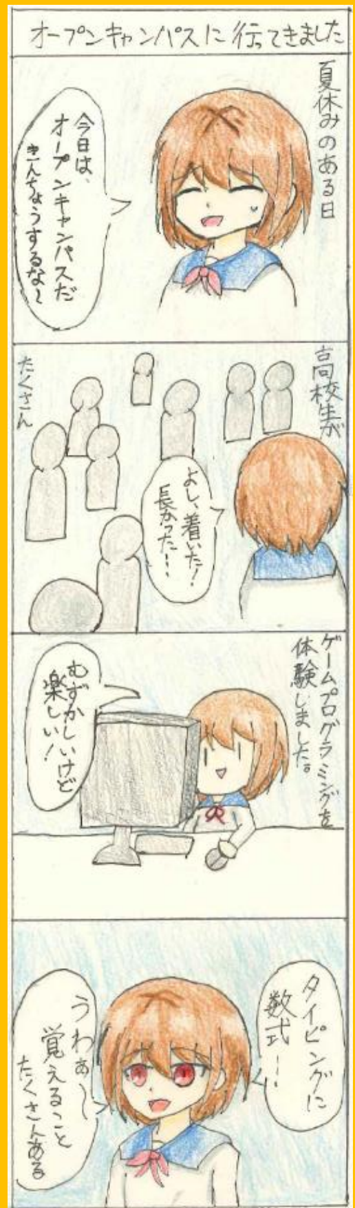
【高等部第1学年】オープンキャンパスに参加し、学習意欲が高まった夏でした。希望する進路に向かってがんばろう！(ストーリー：高崎 絵：本田)