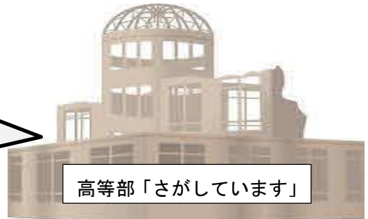
高等部「さがしています」

ビデオ上映での発表を行いました。 原爆が投下されて失ったものたち (時計や軍手、眼鏡など)の気持ち になって演じました。