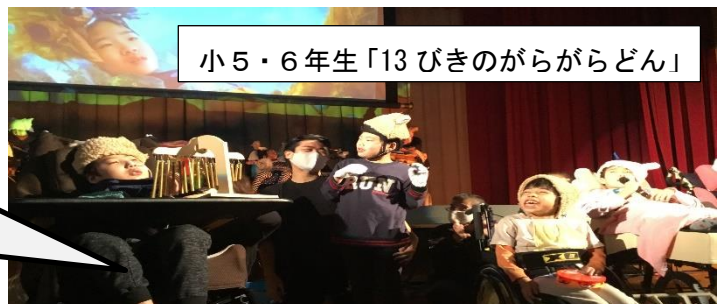
小5・6年生「13びきのがらがらどん」

一人一人の得意なことを活かしながら トロールを倒したあと、みんなで楽しく 合奏をすることができました。